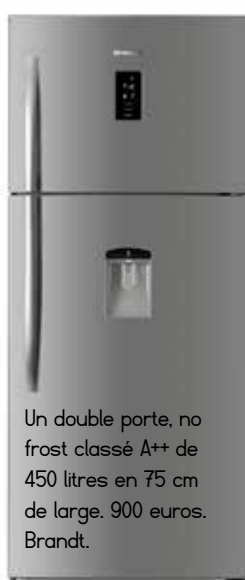
Un double porte, no frost classé A++ de 450 litres en 75 cm de large. 900 euros. Brandt.