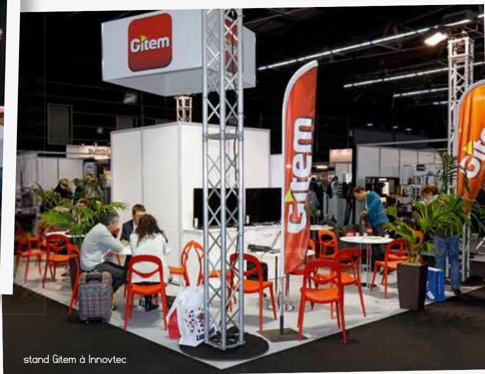
stand Gitem à Innovtec