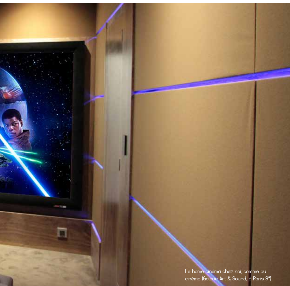
Le home cinéma chez soi, comme au cinéma (Galerie Art & Sound, à Paris 8 e )