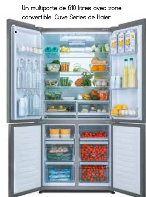
Un multiporte de 610 litres avec zone convertible. Cuve Series de Haier