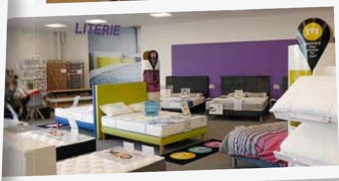
Un rayon literie avec une vraie montée en gamme

D'ailleurs ce n'est pas par hasard que tout l'état-major de GPdis, Pulsat et Selectis était présent pour l'inauguration. 750 m 2 de surface de vente plus 300 m 2 de réserve, le magasin est clair et chaleureux. Un parcours client existe bien mais il n'est pas coercitif comme celui d'une célèbre marque bleu et jaune ! « On voulait que dans les cinq premières secondes le client ait un coup d'œil du magasin à 360°, ce qui explique qu'il n'y ait pas de gondoles très hautes pour ne pas entraver la visibilité » précise Charly Sausseureau, Responsable du développement GPdis.