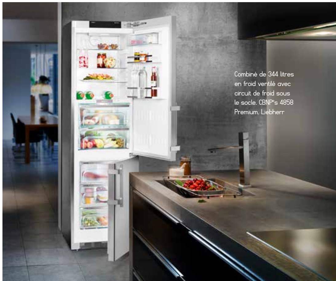
Combiné de 344 litres en froid ventilé avec circuit de froid sous le socle. CBNP's 4858 Premium. Liebherr

Electrolux mise sur le volume de conservation et la flexibilité de ses combinés : les 4 modèles Customflex (de 699 à 1050 euros) s'insèrent dans une largeur de 60 cm et des hauteurs allant jusqu'à 2m. Deux circuits de froid équipent les appareils : froid brassé dans le réfrigérateur avec 2 compartiments Freshzone à température et hygrométrie contrôlées et froid ventilé no frost dans le congélateur. La contreporte est équipée d'un kit Customflex de rangements modulables dans un plastique de bonne qualité. Le niveau sonore va de 40 à 43 dB.