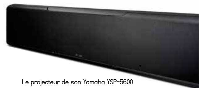
Le projecteur de son Yamaha YSP-5600 est compatible Dolby Atmos et DTS:X

En poussant à l'extrême, le MX122 de McIntosh intègre les toutes