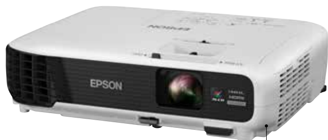
Avec Demooz, Epson permet de tester gratuitement l'EB-U04 avant de l'acheter