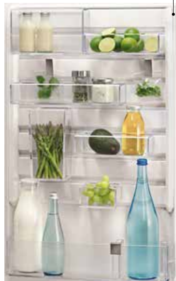
Combiné Customflex avec kit de rangement modulable. Electrolux

Tous les combinés Blu Performance de Liebherr sont prêts à être connectés aux Smartphones ou tablettes : l'option SmartDeviceBox sera disponible d'ici 2017, elle permettra de gérer les températures des différents compartiments et d'établir un diagnostic de pannes à distance. ●