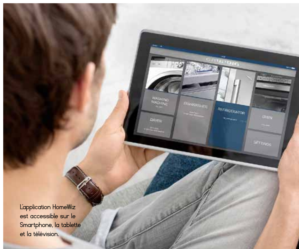
L'application HomeWiz est accessible sur le Smartphone, la tablette et la télévision.

Même complicité chez Electrolux entre la hotte à technologie Hob2Hood et la table induction InfiFlex qui s'enrichit cette saison de nouveaux modèles. « La communication se fait par une connexion infrarouge,