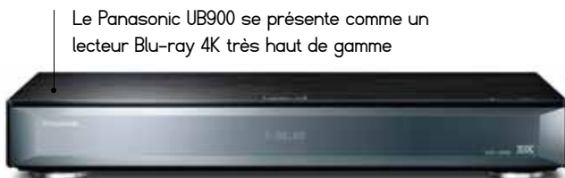
Le Panasonic UB900 se présente comme un lecteur Blu-ray 4K très haut de gamme