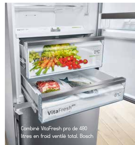
Combiné VitaFresh pro de 480 litres en froid ventilé total. Bosch

« Whirlpool a inauguré de nouvelles plateformes pour les combinés et double porte en 70 cm de large précise Paolo Cuzzolin chef de produit : nouvelle esthétique, froid ventilé total et capacités allant jusqu'à 450 litres ». Il existe aussi une offre en 60 cm de large, en froid ventilé no frost avec 2 circuits et 2 évaporateurs qui permettent une gestion d'humidité dans le réfrigérateur. Hotpoint nouvelle marque du portefeuille de Whirlpool, s'inscrit dans le cœur de gamme avec des combinés de 60 cm qui se distinguent par un beau design, une poignée miroir avec commandes intégrées, un seul circuit en froid no frost. Le modèle de 369 litres offre praticité et flexibilité : dans le réfrigérateur, un système d'oxygène actif détruit les bactéries de l'air ; un bac Ultra Fresh avec gestion d'humidité permet la conservation des fruits et légumes ; une zone 3 en 1, très flexible, permet de ranger un plat chaud et d'en abaisser très vite la température (de 70 à 3°C), de servir de tiroir à 0° pour la viande et le poisson, ou enfin de décongeler en douceur un plat congelé. Avec un modèle à 1000 euros la marque Hotpoint devrait vite se rendre attractive auprès du public français.