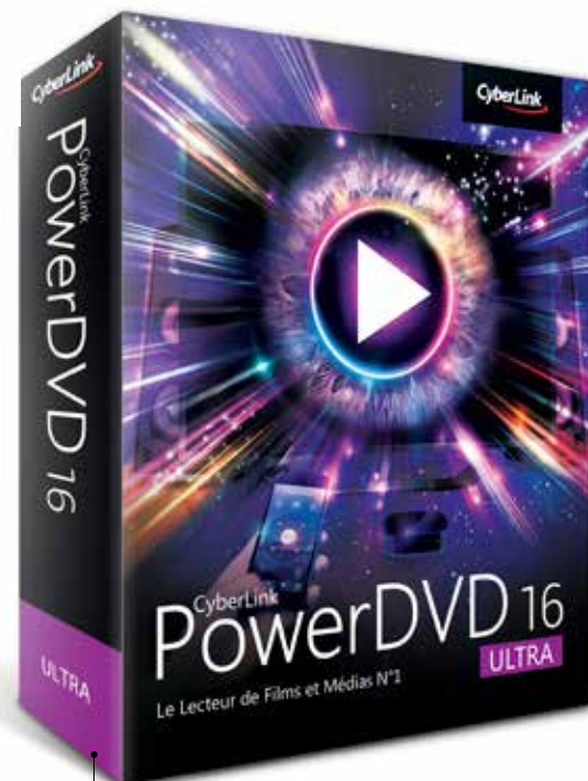
PowerDVD 16 dispose d'un nouveau mode TV pour profiter pleinement de ses films sur grand écran