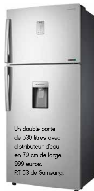
Un double porte de 530 litres avec distributeur d'eau en 79 cm de large. 999 euros. RT 53 de Samsung.