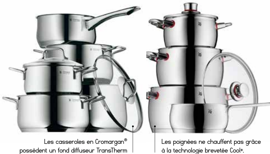
Les casseroles en Cromargan® possèdent un fond diffuseur TransTherm

Pour SEB, l'un des principaux atouts de WMF est incontestablement sa position de n°1 mondial sur le marché des machines à café professionnelles, d'une part parce que le professionnel ouvre les portes des machines grand public et d'autre part parce que les machines à café professionnelles constituent un marché attractif, en forte croissance, rentable et récurrent. C'est un marché sur lequel il existe de fortes barrières à l'entrée : la puissance de la marque, la techno-