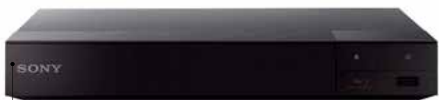
Le BDP-S6700 est compatible avec la technologie Sony multiroom