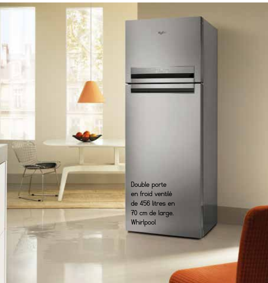
Double porte en froid ventilé de 456 litres en 70 cm de large. Whirlpool