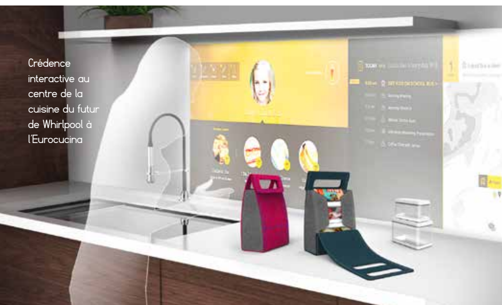
Crédence interactive au centre de la cuisine du futur de Whirlpool à l'Eurocucina

compte des besoins identifiés lors de nos études consommateurs. Elle propose également une large gamme de contenus pour l'entretien des appareils. La connectivité est aussi utile en cas de panne avec la fonction diagnostic à distance. En cas de dysfonctionnement, l'utilisateur reçoit des conseils correspondant au type d'anomalie constatée. S'il ne peut pas résoudre le problème il est assisté par le SAV qui peut programmer