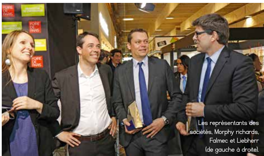
Les représentants des sociétés, Morphy richards, Falmecc et Liebherr (de gauche à droite).