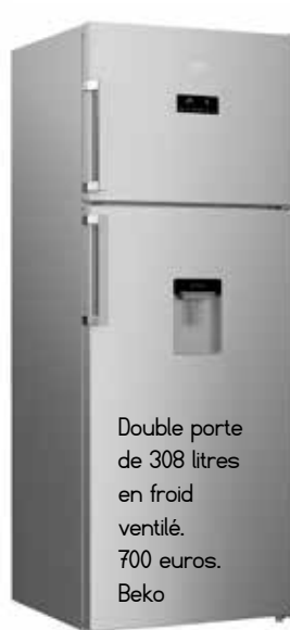
Double porte de 308 litres en froid ventilé. 700 euros. Beko