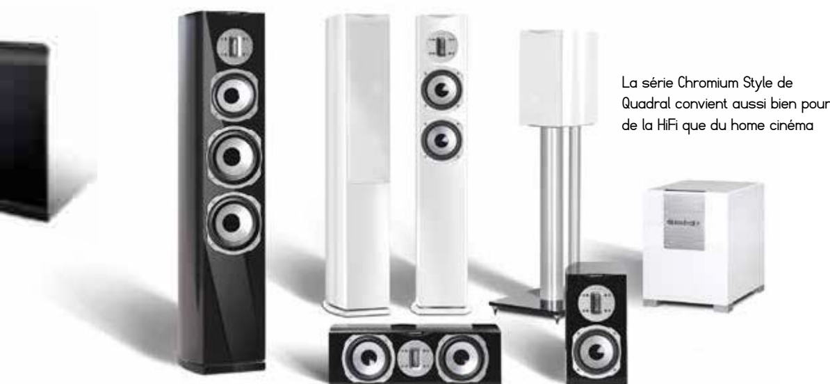
La série Chromium Style de Quadral convient aussi bien pour de la HiFi que du home cinéma