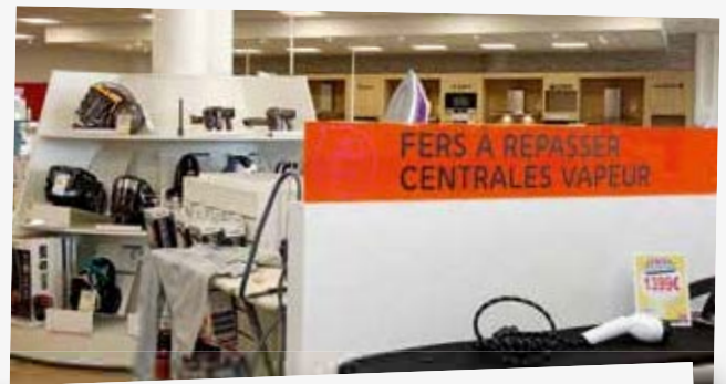
Des produits en démonstration