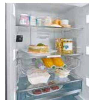
Réfrigérateur Home Connect de Siemens avec caméras intégrées

À chaque besoin et à chaque appareil sa solution, ceci avec une même application. C'est le choix de Candy avec « Simply-fi » une application compatible Smartphone, ta-