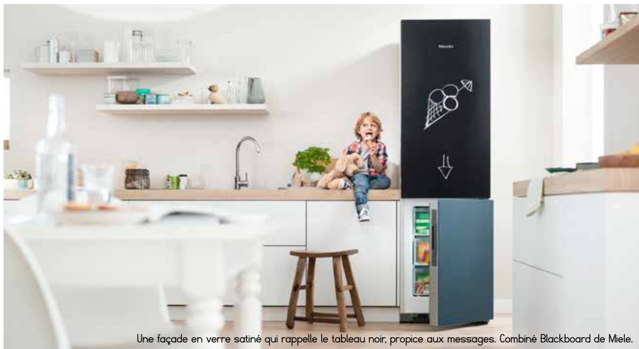
Une façade en verre satiné qui rappelle le tableau noir, propice aux messages. Combiné Blackboard de Miele.

Cette technique lancée par les américains puis reprise par les coréens s'affirme : la corvée de dégivrage est supprimée, les appareils sont peu gourmands en énergie et on peut régler finement la température des différents compartiments, selon les aliments conservés. L'idéal, pour les français qui aiment bien les produits frais !