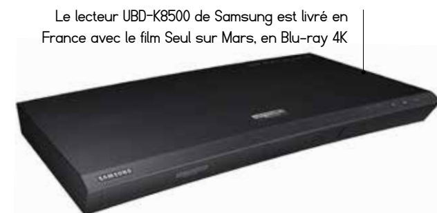
Le lecteur UBD-K8500 de Samsung est livré en France avec le film Seul sur Mars, en Blu-ray 4K