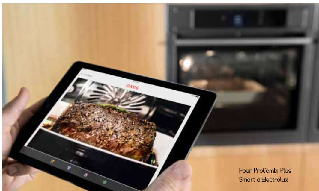
Four ProCombi Plus Smart d'Electrolux