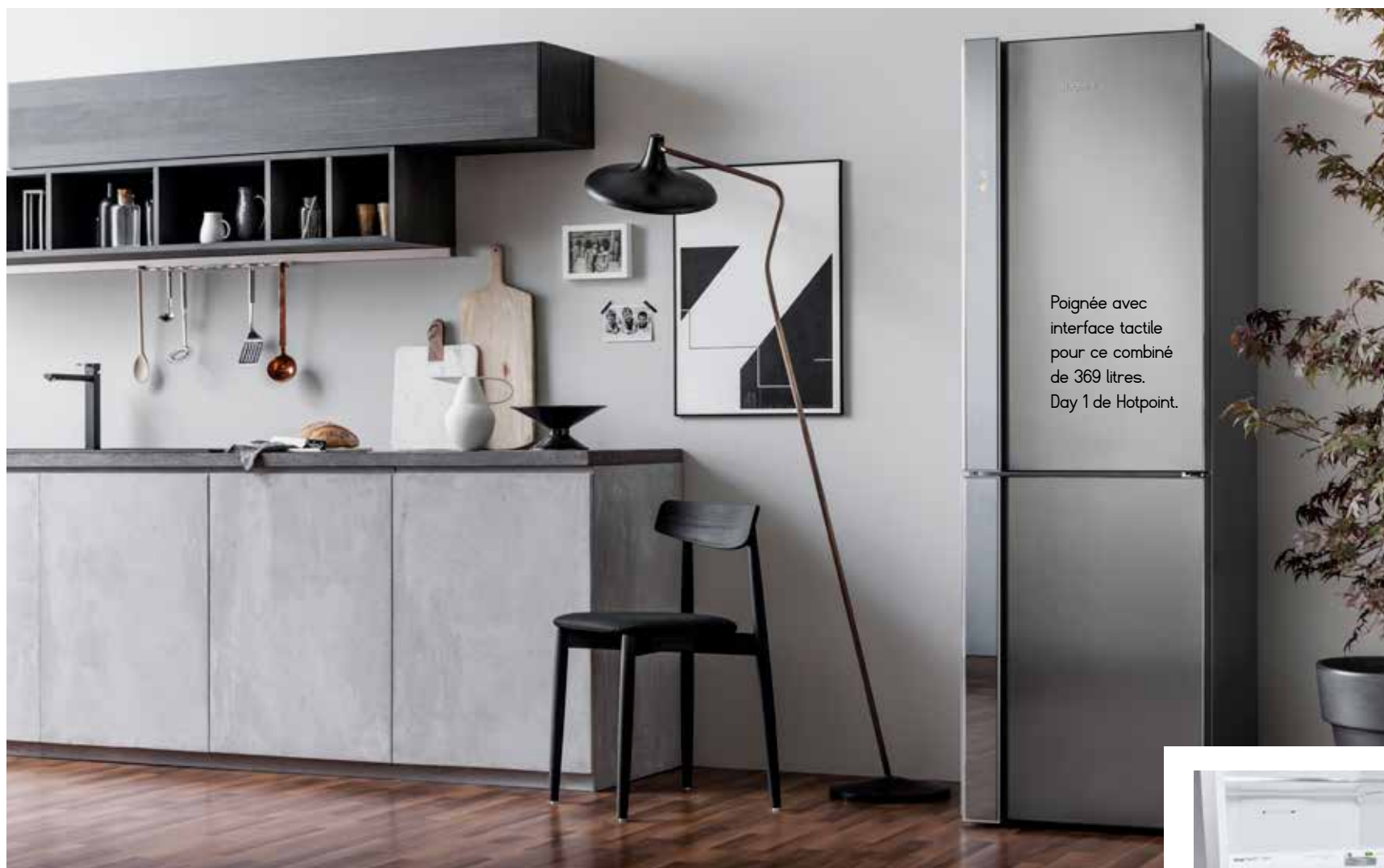
Poignée avec interface tactile pour ce combiné de 369 litres. Day 1 de Hotpoint.