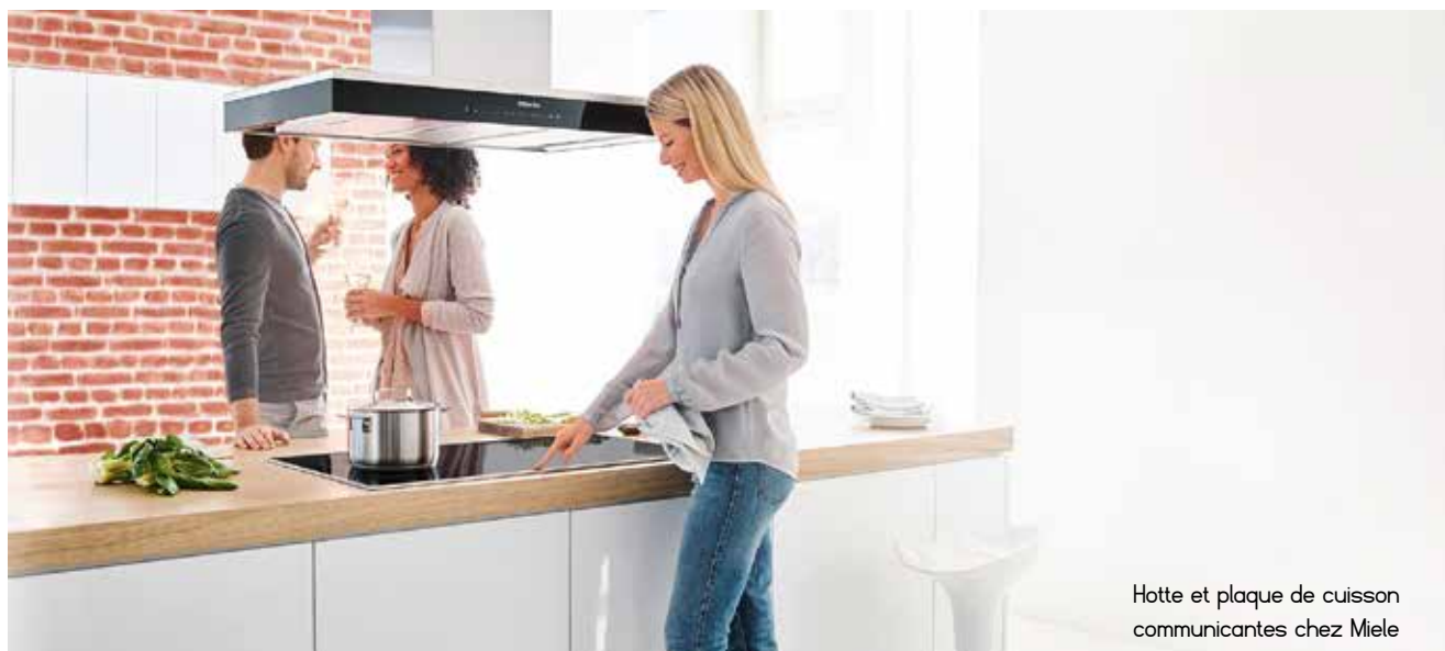
Hotte et plaque de cuisson communicantes chez Miele