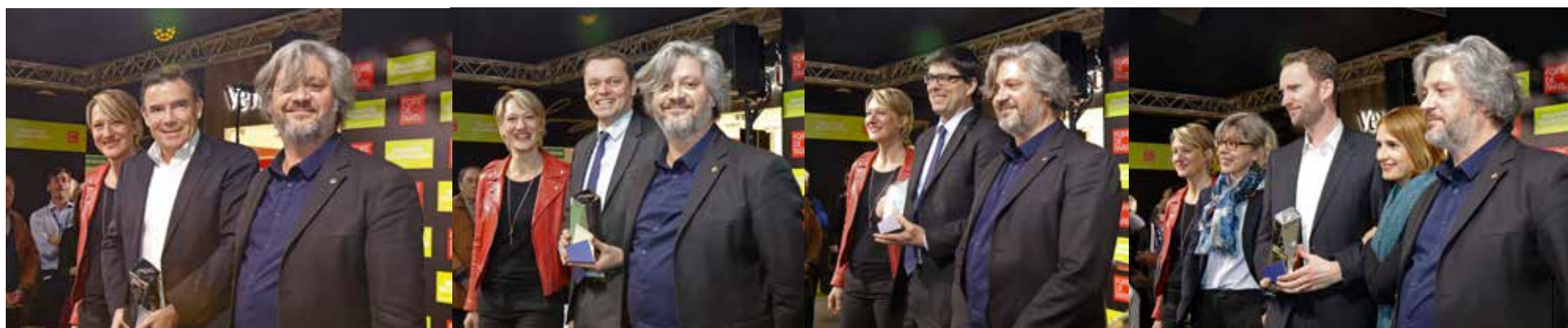
Les lauréats de gauche à droite : DeLonghi, Falmecc, Liebherr et Rowenta