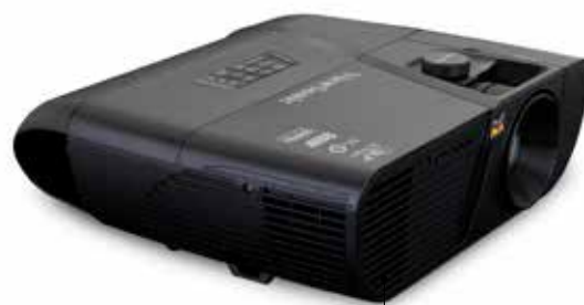
Le Pro7827HD de Viewsonic est un vidéoprojecteur à prix très abordable