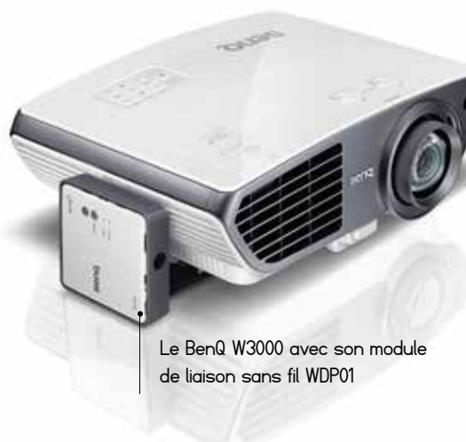
Le BenQ W3000 avec son module de liaison sans fil WDP01