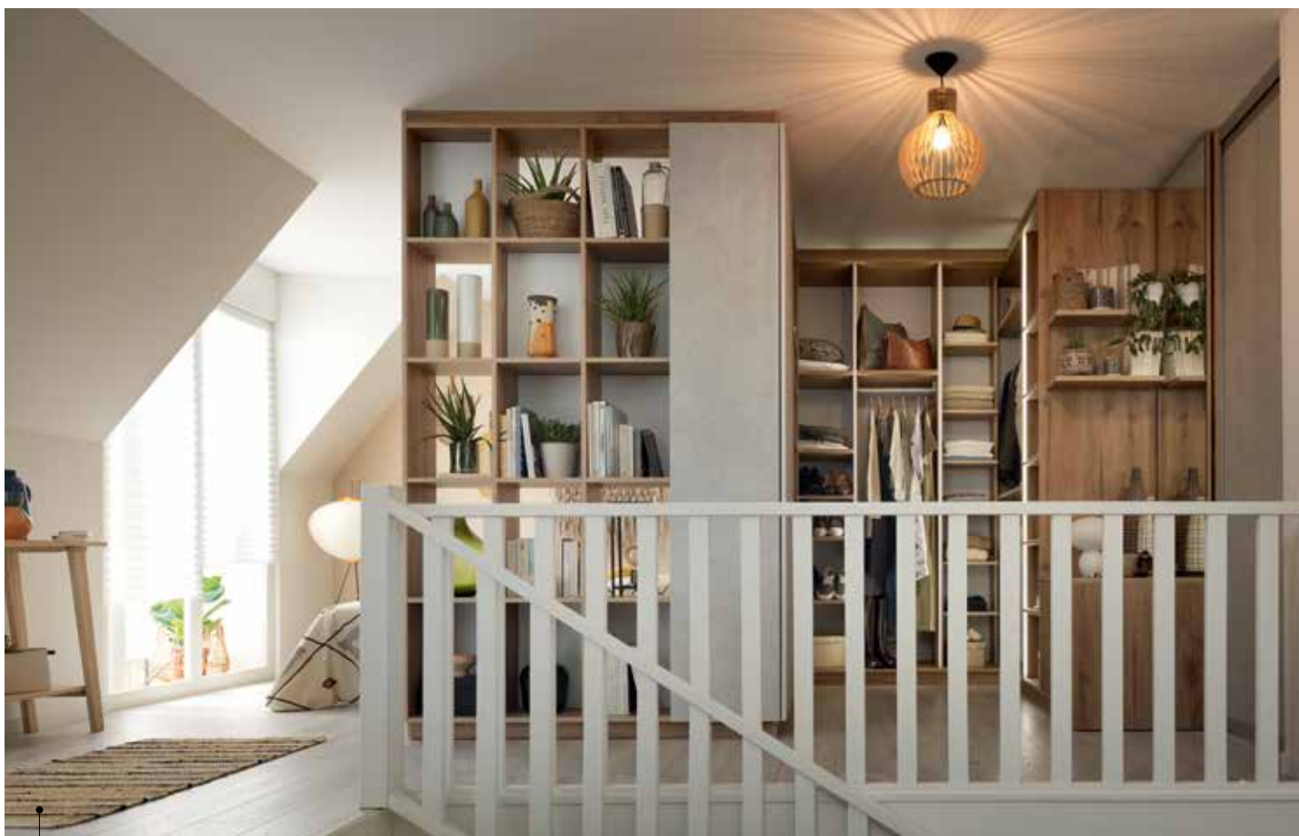
Schmidt, Dressing garde robe de la collection Origin réalisée en matériaux recyclés