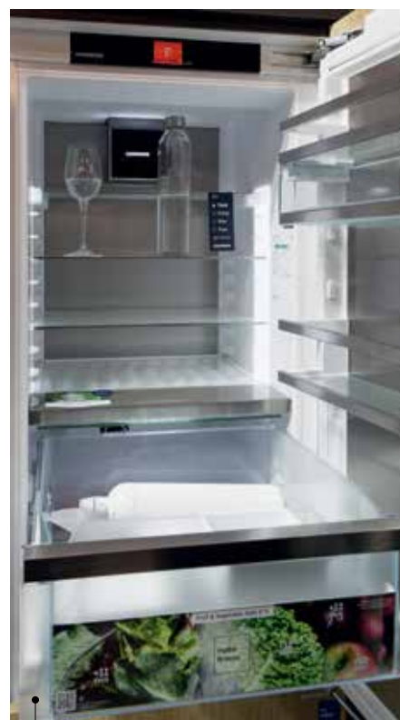
Liebherr : PEAK, Prix S-Awards Électroménager