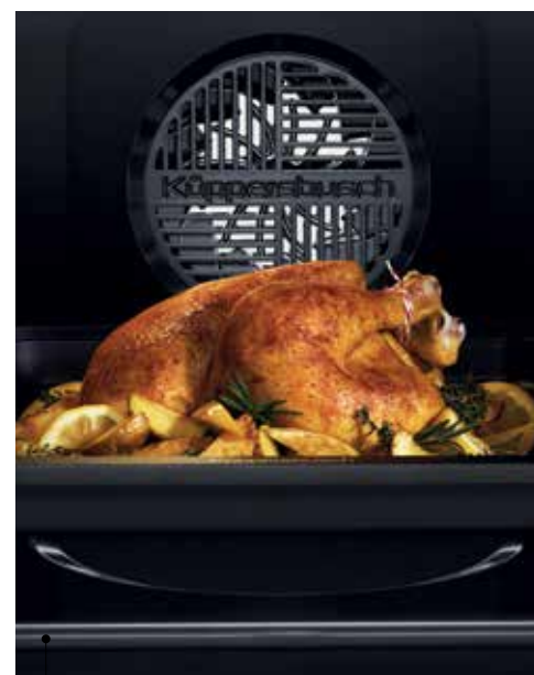
Küppersbusch : four ÖkoTherm

Jean-Christophe Nicodème, président de Teka France se félicite d'une année 2020, sans rupture de stocks, ni problèmes d'approvisionnements puisque 80% des appareils proviennent des usines européennes du groupe. Chaque modèle bénéficie d'un atout spécifique : le four multifonction Maestro Pizza monte à 340°C, est équipé d'une pierre à pizza et d'une pelle en inox pour enfourner. Avec un préchauffage de 30 minutes, on peut enchaîner les pizzas toutes les 3 mn. Ce four multifonction pyrolyse est doté d'une porte froide (4 verres), de rails télescopiques, d'une fonction turbo à un prix attractif de 900 euros. Déjà connu, le four Steak Master est doté d'un gril à 700°C qui cuit une côte de bœuf saignante en 6 mn avec le même résultat qu'une cuisson au barbecue.