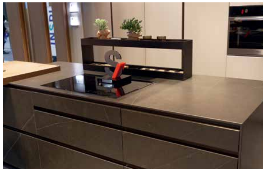
Plan de travail STOSA. Prix S-Awards Meuble : pour le modèle Metropolis

pour la nouvelle gamme Natura de Nobilia, toucher et aspect visuel proche du bois véritable.