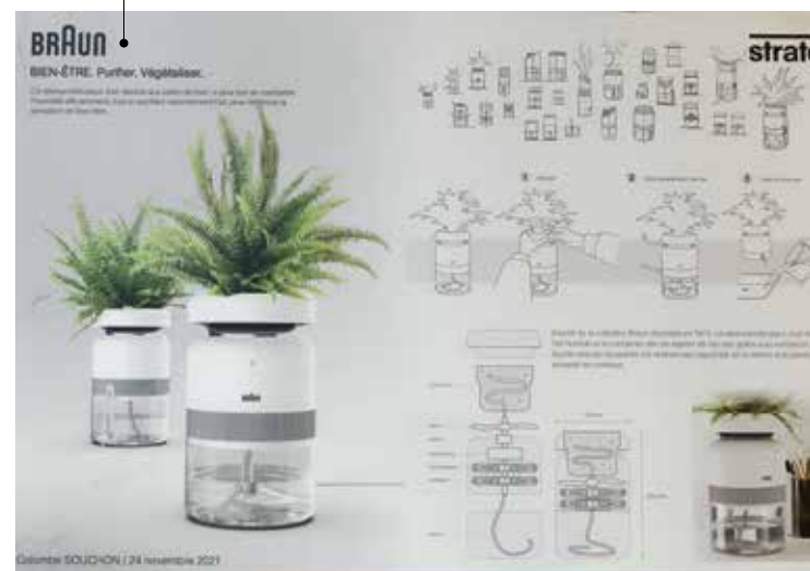
Colombe SOUCHON | 24 novembre 2021