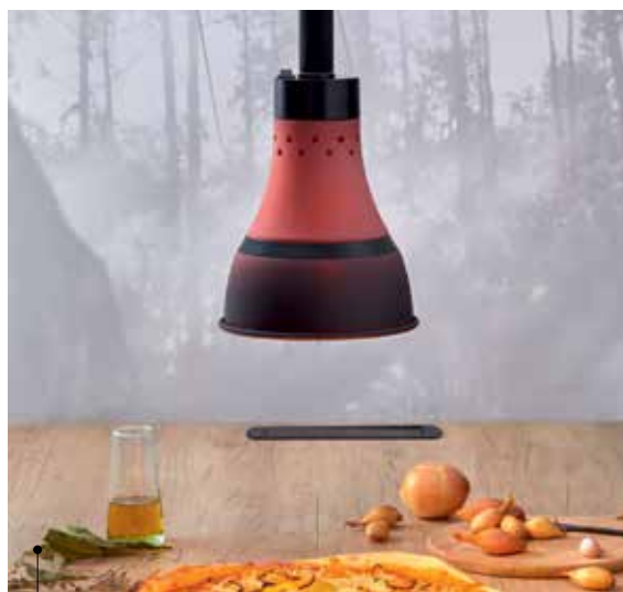
MSA Lampe chauffe-plat Solar

Du design dans le fonctionnel chez Mobilier Carrier et sa nouvelle collection de chaises, tabourets, tables