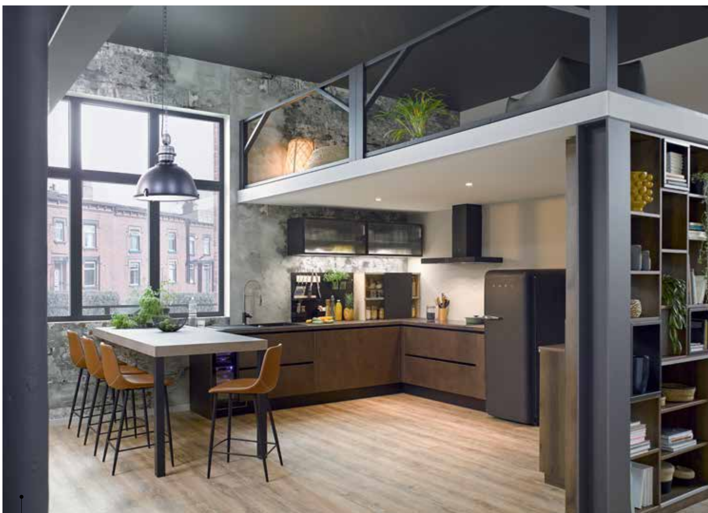
Cuisinella : Cuisine E-Label