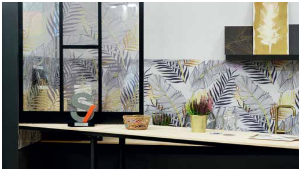
Collection Artiste (Pixpano) Prix S-Awards Équipements et accessoires