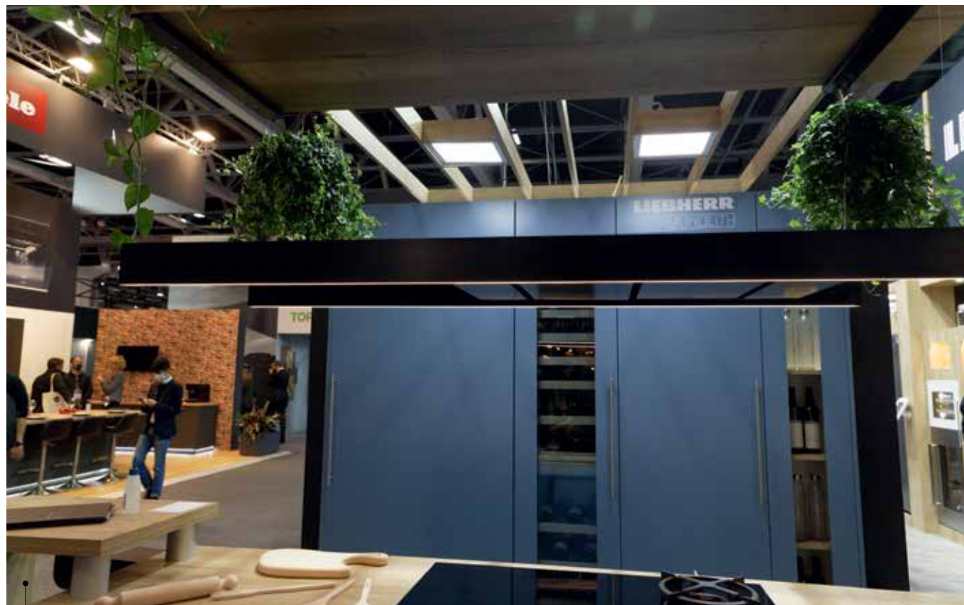
La hotte décorative FALMEC et les caves Monolith de Liebherr

Asko présente un lave-vaisselle de 17 couverts (2 000 euros) qui offre 4 niveaux de panier, le turbo-séchage dans une hauteur de 86 cm.