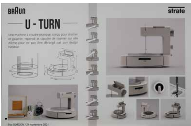
Machine à coudre d'Elsa Guedon.