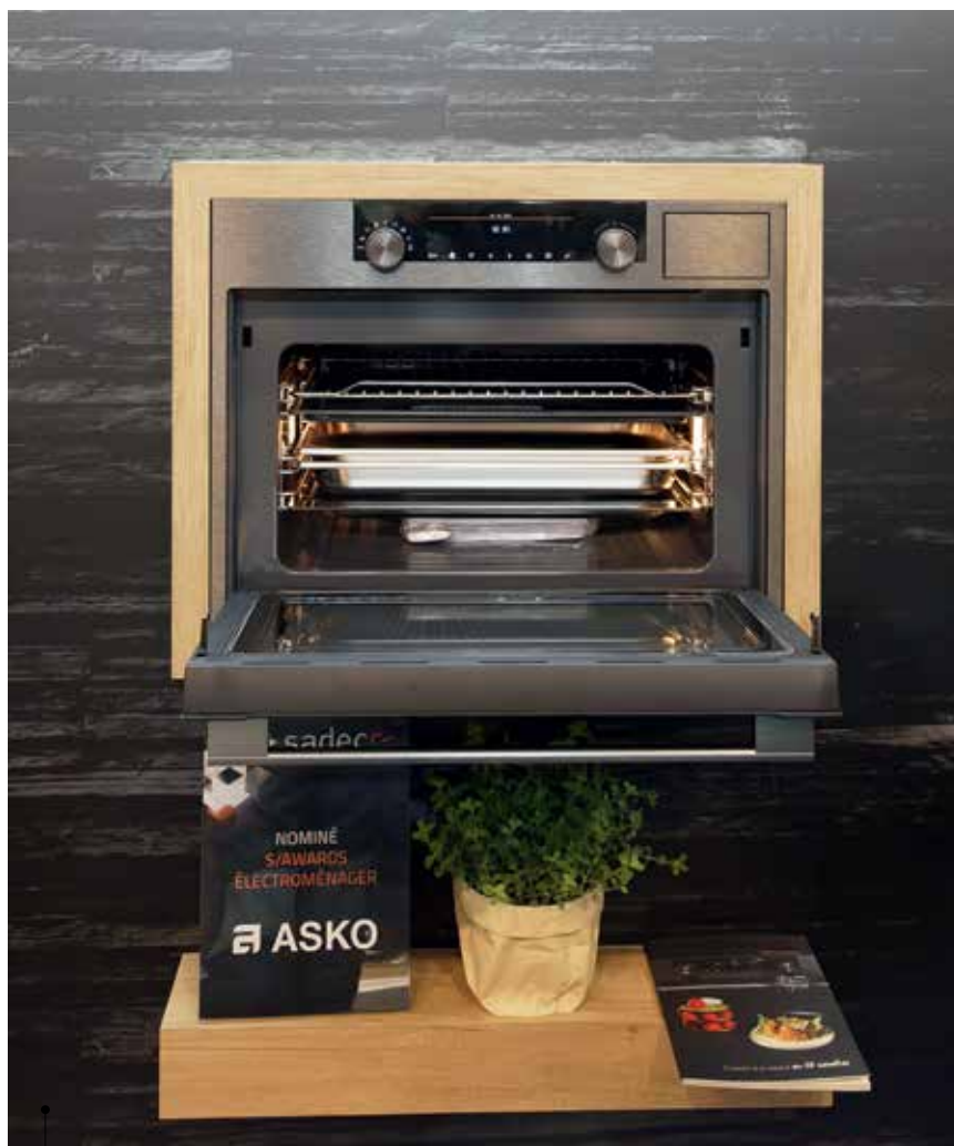
Asko : four 5 en 1

Rappelons aussi la collection Fascination, signée De Dietrich avec la table à induction Perfect Sensor qui comporte 5 fonctions automatiques pré-programmées associées à une sonde Bluetooth. La table est dotée