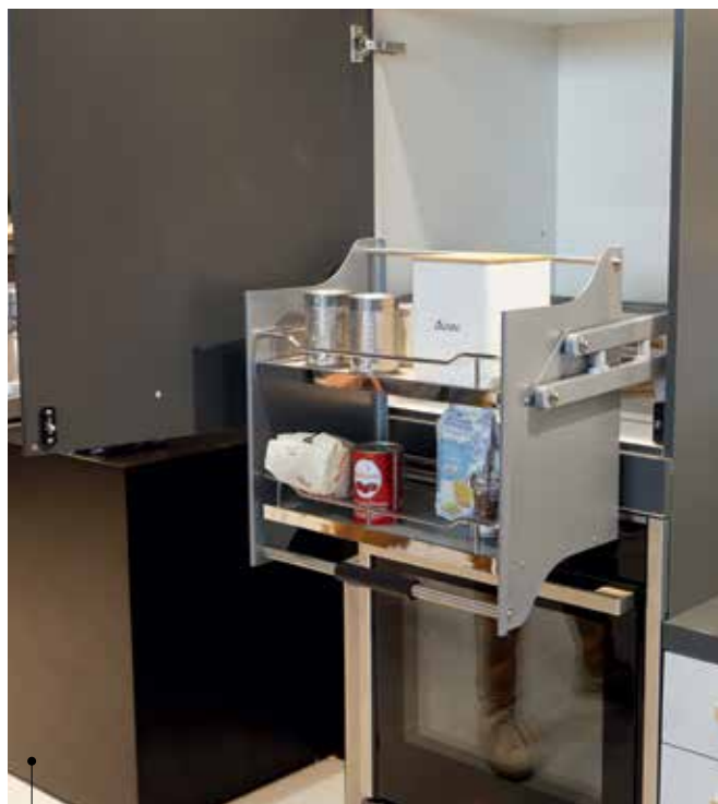
AMR Concept (étagère basculante). Prix S-Awards Spécial Jury

Pour sa part, l'Allemand Nobilia enrichit son offre de 10 nouveaux plans de travail, dont deux en quartz et cinq en céramique, montés sur une plaque de verre recyclé doté d'un chant design résistant aux chocs. Le matériau tendance est le «compact», (stratifié haute résistance) devenu une matière incontour-