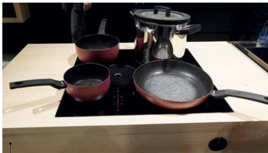
Plaque avec hotte aspirante de chez BORA

Parmi les tendances fortes, le noir qui habille l'électroménager, les meubles, dépourvus