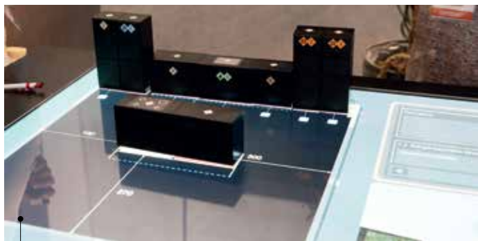
Table 100 % digitale (Touch-Reality). Prix S-Awards Produits et Services

Sur le stand du Sadecc, AMR Concept a présenté, entre autres, le projet d'une cuisine familiale équipée de mécanismes spécifiques : possibilité de mettre à hauteur l'évier et la plaque de cuisson (Lineo Concept), meubles hauts équipés d'étagères basculantes (Self Move) pour rendre accessible à tous l'intégralité de leur contenu.