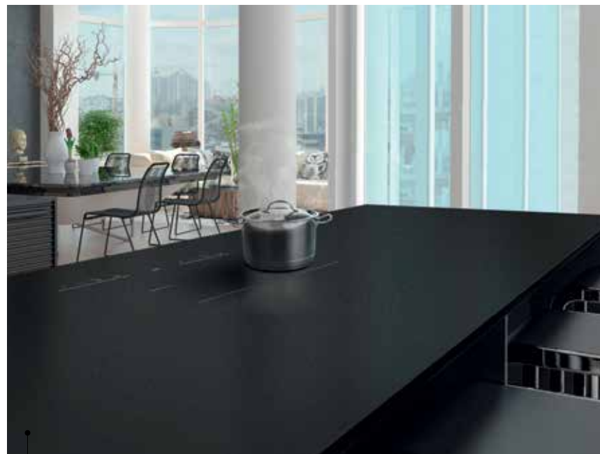
Plan de travail de chez Versâtis

Elica propose aussi une table aspirante Nicola Tesla Fit qui s'intègre dans un meuble de 60 x 60 cm : la fonction Autocapture ajuste automatiquement la vitesse optimale d'aspiration en fonction du type de cuisson. En version recyclage, les filtres céramiques se régénèrent pendant 5 ans.